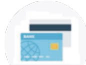
クレジットカード