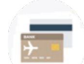
JALマイレージバンクカード